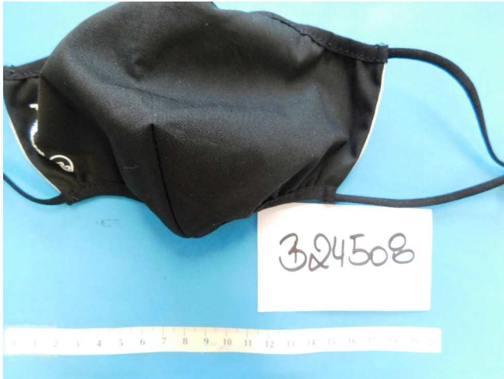
Abb. 1: Pro Mask